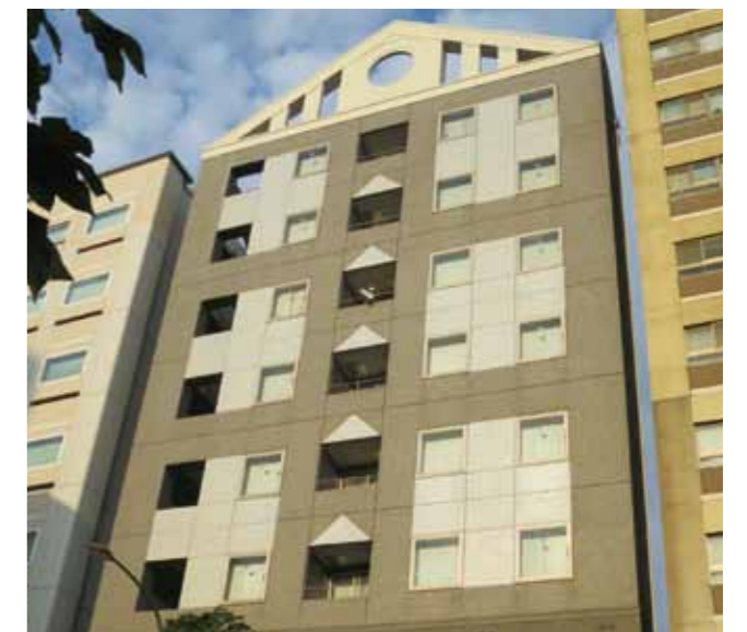
物件例：大京町PJビル