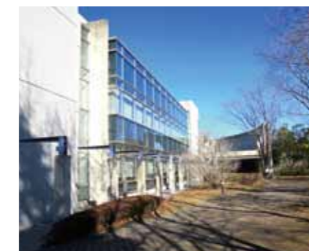
物件例：大都富士ガーデン