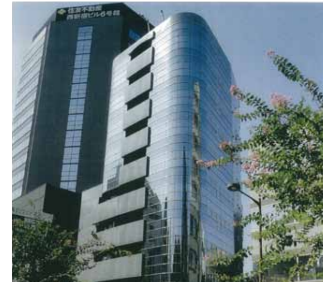
物件例：渋谷本町ビル