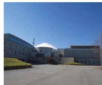
物件例：大都富士リゾートハウス