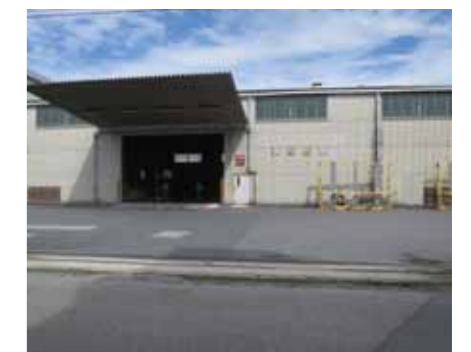
物件例：千葉県市原市貸倉庫