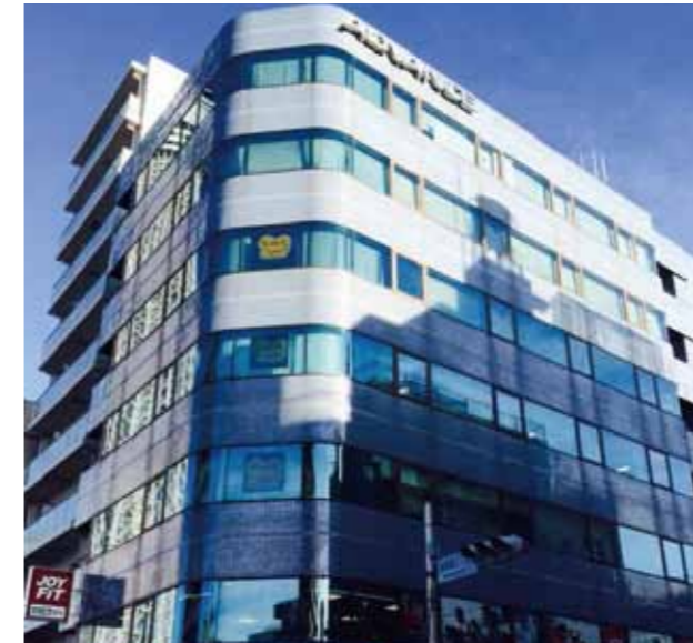
物件例：吾妻橋ビル